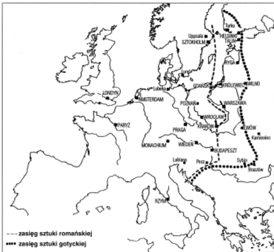
Rys. 2. Zasięg sztuki romańskiej i gotyckiej