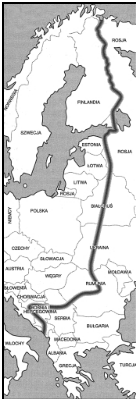
Rys. 1. Linia Huntingtona