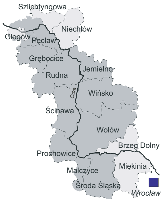
Ryc. 2. Obszar działania Partnerstwa Doliny Środkowej Odry. Ciemniejszym odcieniem zaznaczono gminy, które formalnie weszły do Programu Pilotażowego LEADER+

miejską, 4 powiaty, 16 organizacji pozarządowych, 2 nadleśnictwa i 1 prywatne przedsiębiorstwo. Grupa nie ma formalnego statusu prawnego i opiera swoje struktury na dobrowolnych deklaracjach współpracy. Głównym celem PDŚO jest „zintegrowanie działań instytucji, organizacji, samorządów lokalnych, przedsiębiorców oraz wszystkich innych środowisk działających w regionie na rzecz rozwoju zrównoważonego i ochrony dziedzictwa przyrodniczo-kulturowego tego obszaru”. Sekretariat partnerstwa prowadzi FEZA i ona też formalnie odpowiada za realizację projektów firmowanych przez PDŚO.