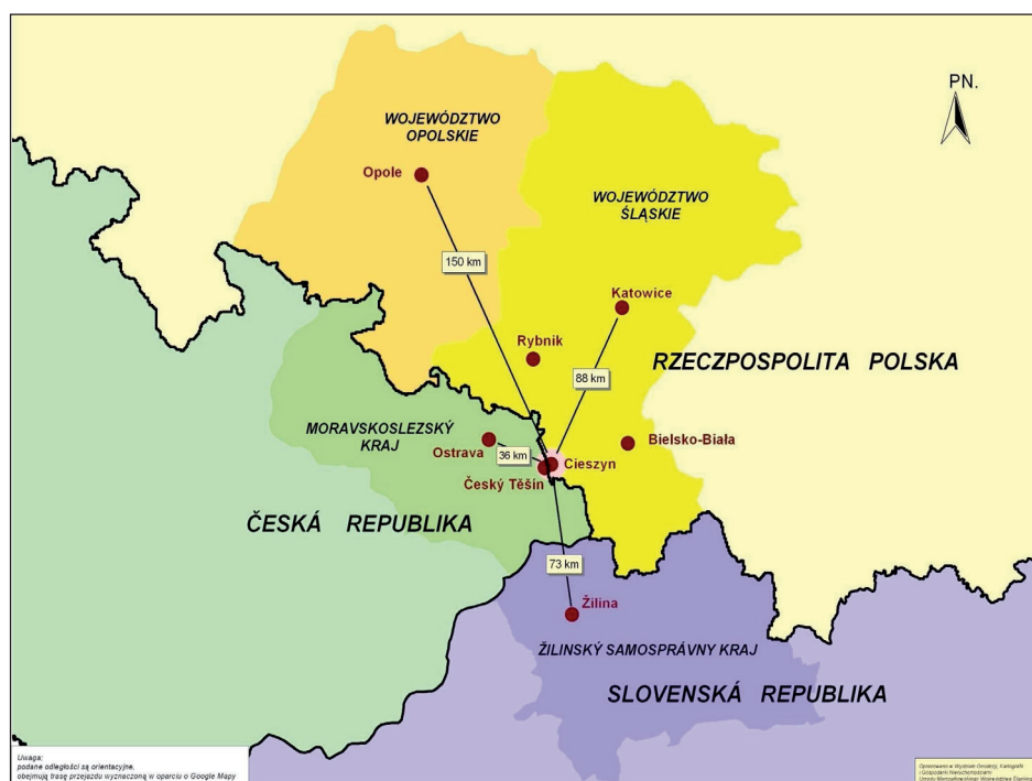
Ryc. 3. Mapa administracyjna EUWT TRITIA

Europejskiego Ugrupowania... , s. 1). Na poziomie europejskim projekt powstania EUWT TRITIA po raz pierwszy zaprezentowano w czerwcu 2010 r. w Jaén (Hiszpania) w trakcie posiedzenia Komisji Spójności Terytorialnej COTER przy Komitecie Regionów UE 13 . Do chwili obecnej udało się stronom współpracy wynegocjować przepisy Konwencji oraz Statutu nowego EUWT. Oba dokumenty zostały wstępnie przyjęte przez organy założycielskie czterech regionów tworzących ugrupowanie. W lutym 2012 r. zatwierdził je Sejmik Województwa Śląskiego. Upoważnił również Marszałka Województwa do ich podpisania i zgłoszenia ugrupowania do właściwego rejestru 14 .